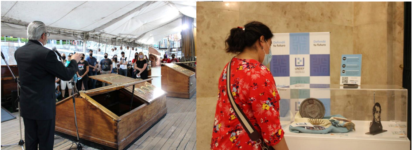
En la Corbeta Uruguay y el hall del Ministerio de Defensa.

conocer la oferta académica de la UNDEF en el stand de la Red de Museos de la Defensa (REMUDEF), ubicado en el hall del edificio.