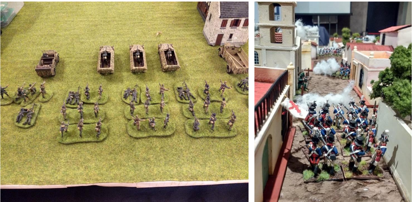
Diferentes propuestas de modelismo.

Las escalas y proporciones con las que se trabajó fueron las siguientes: una figura = 30 soldados, un modelo de cañón = tres cañones. La escala de terreno era de 1:500.