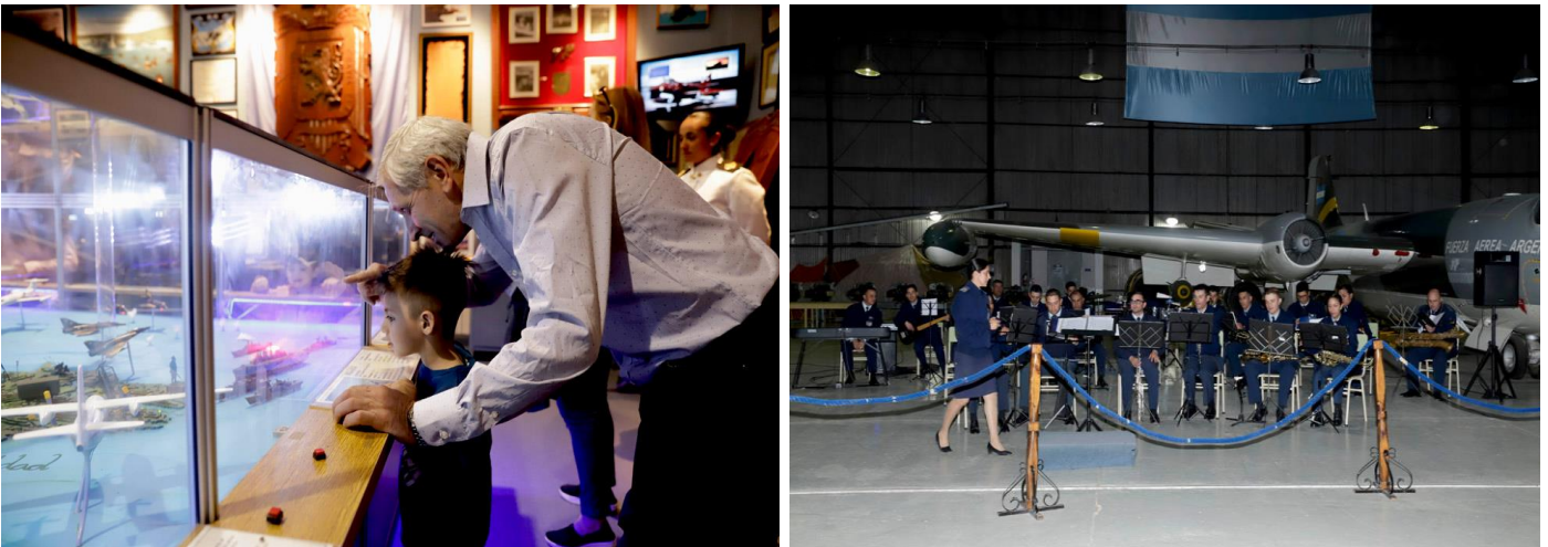
Maquetas y música en la Escuela de Aviación Militar.

También interpretó un interesante repertorio musical la banda militar "Suboficial mayor Juan Vulcano".