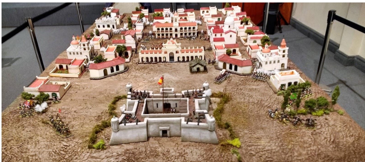
Modelismo militar estático.

Además, el Círculo Argentino de Modelismo contribuyó con una exhibición de modelismo militar estático, lo que permitió a los asistentes apreciar el arte y la técnica detrás de esta actividad. Las visitas guiadas y la participación de la banda de la fuerza aérea "Alas Argentinas" hicieron que la experiencia fuera aún más enriquecedora.