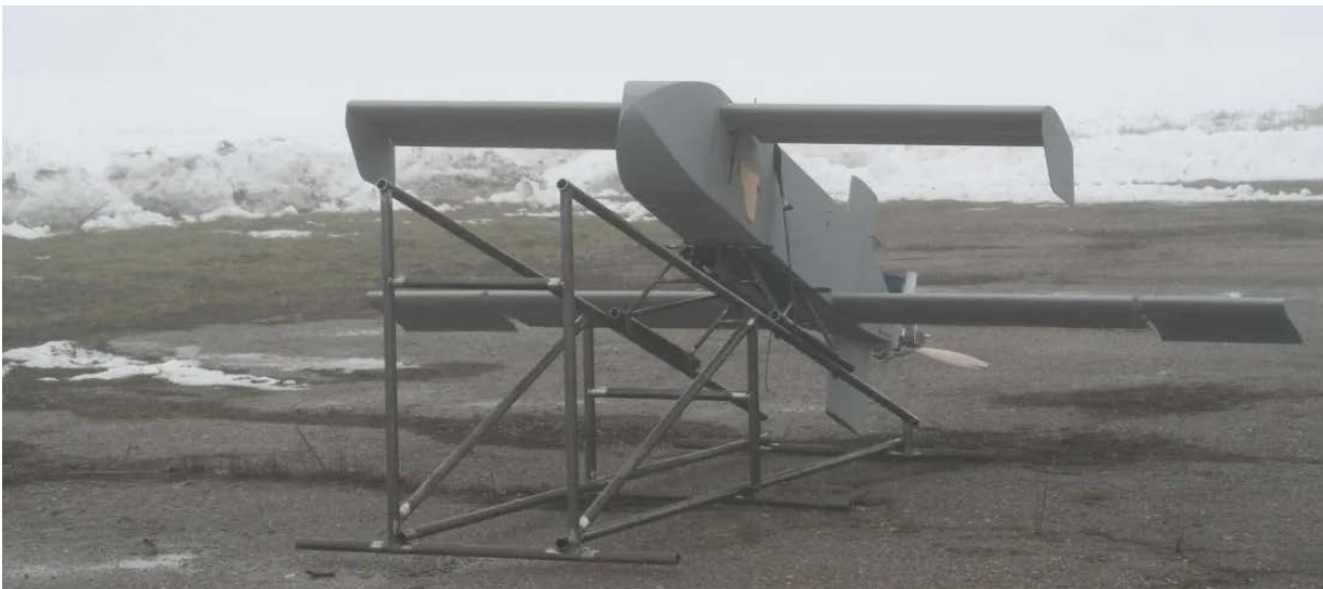
Los drones ucranianos como estos están ahora equipados con una forma básica de inteligencia artificial, según una fuente cercana al programa de drones de Ucrania.

• Rusia y Ucrania están experimentando con navegación autónoma y reconocimiento de objetivos. Para ello utilizan IA para mejorar la efectividad de los drones sin necesidad de conexión satelital. Este avance podría proporcionar una ventaja decisiva en términos de potencia de fuego y capacidad operativa y reducción de costos que se traducen en rapidez, precisión y economía de recursos.