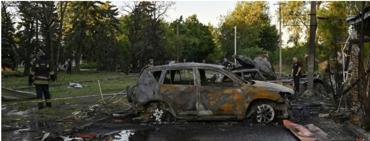
Bomberos y policías trabajan en el lugar de un ataque con misiles rusos en la ciudad de Vilniansk, en la región de Zaporíyia.