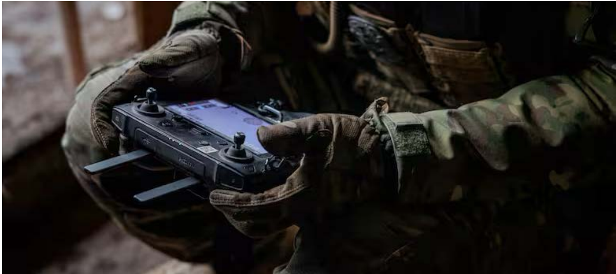
Un piloto ucraniano maneja un dron en la región oriental de Donetsk