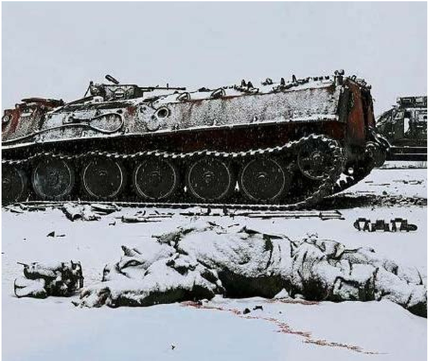
Soldado muerto junto a uno de los blindados rusos neutralizados por las fuerzas ucranianas en Jarkov

ARTÍCULO DEL SR. FÉLIX FLORES, ACTUALIZADO A 26/02/2022 12:13, HTTPS://WWW.LAVANGUARDIA.COM