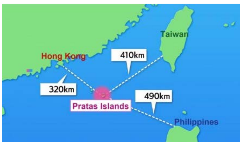
Posición relativa de la isla Pratas o islas Dongsha

Como se puede apreciar en el gráfico, los vuelos de marzo de 2024, en el sur de Taiwán, se realizaron cerca de la isla Pratas o islas Dongsha, que se encuentra al norte del Mar de China Meridional y más cercana a Hong Kong que a Taiwán. En estas islas está desplegado un contingente militar de Taiwán con una pista de aterrizaje.