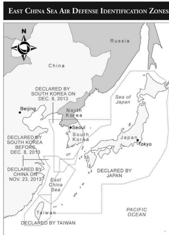
Delimitación de las ADIZ en el mar de la china oriental 5

que como se ha observado en la guerra Rusia Ucrania, los ucranianos despliegan globos meteorológicos con receptores de guerra electrónica y cámaras infrarrojas que le permiten identificar / degradar las señales de radiogoniometría de los radares de defensa aérea rusas. 56