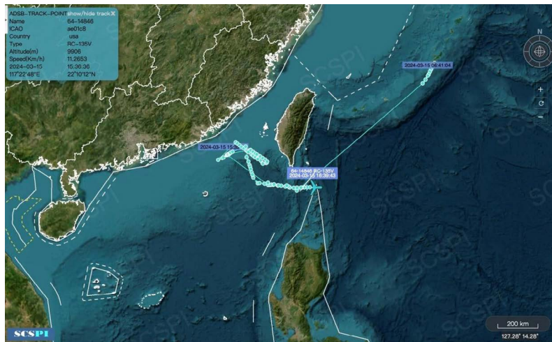
Gráfico del vuelo del sistema RC 135 11

A modo de ejemplo en el presente gráfico se muestra el traqueo y zona donde operó un sistema RC – 135 V, el 15 de marzo de 2024.