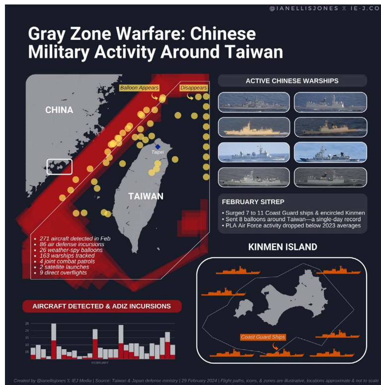
Actividad Militar China alrededor de Taiwán 5 .

“La reunificación de China con Taiwán es inevitable”, afirmó el presidente Xi Jinping en su discurso de Año Nuevo, el domingo 31 de diciembre de 2023. ¿Existe una posibilidad de que China se lance a resolver la cuestión de Taiwán por la vía militar? Puede que sí, sobre todo si cuenta con la capacidad para hacerlo y si las presiones de los sectores más beligerantes superan a Xi Jinping, entre ellos los líderes del EPL. Estos, por ejemplo, mal aconsejaron y presionaron a Mao para atacar a los soviéticos en la frontera chino-rusa en 1969 y a Vietnam diez años después, ambas empresas resultaron en errores garrafales. El presidente chino por ahora parece controlar la situación, pero ¿cuánto tiempo pasará hasta que alguno dispare por error o genere una provocación de la cual no haya vuelta atrás? Para explicar mejor este ejemplo, recordemos la situación de la crisis de los misiles de Cuba, tan bien representada en la película “Trece Días”, en la cual el presidente Kennedy era presionado constantemente por los militares para resolver este dilema mediante la fuerza. Allí se mostró en dos ocasiones que los líderes del ejército pasaron por encima de la autoridad presidencial y de no ser por la determinación del entonces presidente de Estados Unidos, la situación hubiera terminado de otra manera.